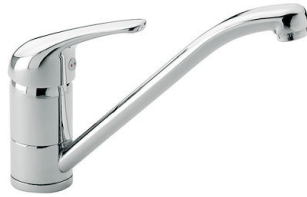
Mitigeur S1000 - RO 8443 002